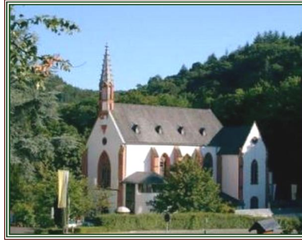
Wallfahrtskirche zur „Schmerzhafte Muttergottes“

Marienthal, dieser besondere Ort der Stille und Begegnung, zählt zu den ältesten Wallfahrtsorten in Deutschland. Kloster und Wallfahrtskirche liegen am sonnigen Südhang des Taunus, im schönsten Teil des Rheingau's. Die Stille und die Schönheit der Natur geben Raum zum Durchatmen, zum Entspannen und zur Besinnung. Rund ums Kloster, kann man die Vielfalt von Gottes Schöpfung erahnen und in Gebet und Meditation seine Gegenwart im eigenen Inneren und in der Natur entdecken.